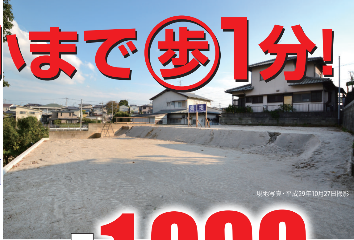
現地写真・平成29年10月27日撮影